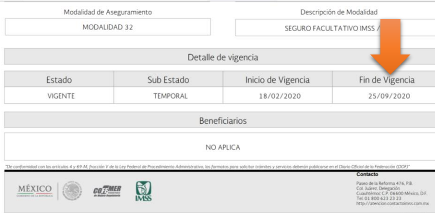
Imagen 07.-fecha fin de vigencia