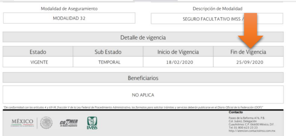
Imagen 07.-fecha fin de vigencia

Indica el día en que realiza la consulta de constancia de vigencia de derechos desde el portal del IMSS