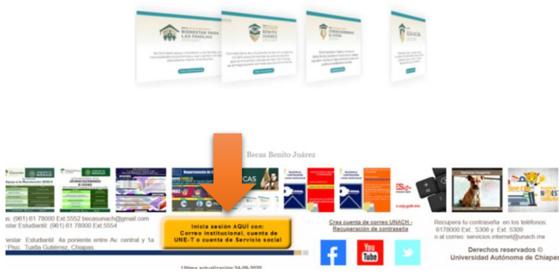
Imagen 08.-iniciar sesión es SIBEES