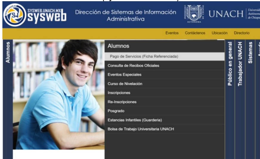
Imagen 09.-ficha de referencia (sysweb.unach.mx)