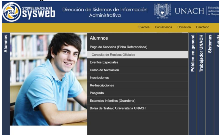
Imagen 11.-Consulta de recibos oficiales.

Consulta de recibos oficiales y descargue su comprobante oficial.